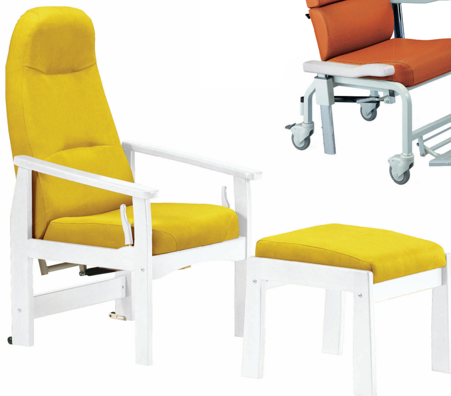
Sillón MÉDI con puf reposapiernas