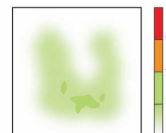
Cojín KINÉRIS monocompartimento