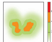
Cojín de espuma HR (Alta Resiliencia) de 6 cm