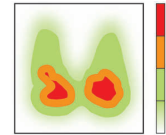
Cojín de gel de poliuretano viscoelástico