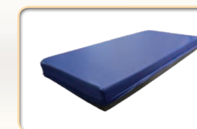
Materac PEDIA Confort z lekko sprężystej pianki mieszanej, zabezpieczony za pomocą pokrowca CIC