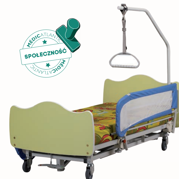
Przeznaczone do placówek zbiorowego zakwaterowania łóżko wykonane z paneli Pitchoune Kalin w kolorze biało-zielonym, z centralnym układem hamowania, barierki z materiału epoksydowego, z pokrowcem zabezpieczającym i słupkiem z materiału epoksydowego