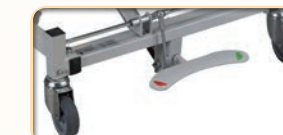
Opcja: centralny układ hamowania. Wysoka dostępność i łatwość aktywacji