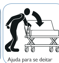
Ajuda para se deitar