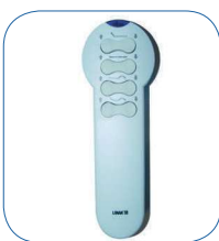
2 comandos à distância por infravermelhos (opcional).