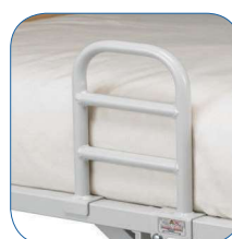
Pega de apoio (disponível como acessório)