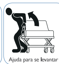
Ajuda para se levantar