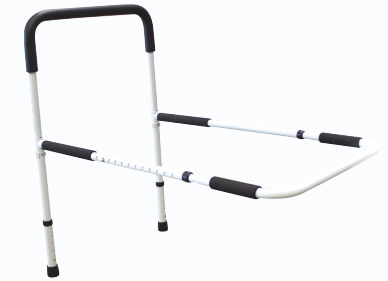
Barre d'appui de lit