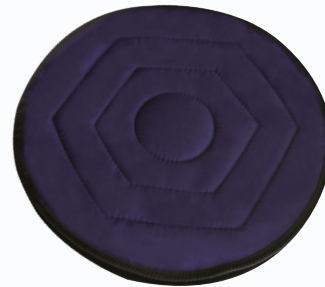
Coussin souple rotatif