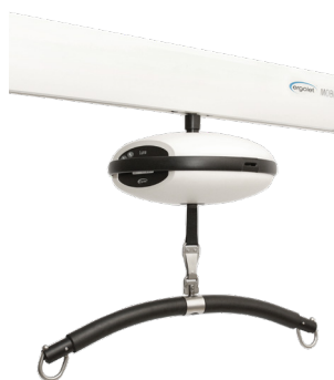
Luna loftlift monteret på Mobile Flex